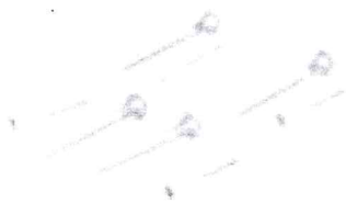
Tornillos de montaje