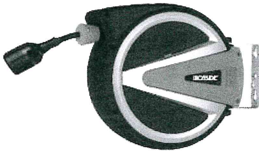
Carrete de cable con enchufes VDE.