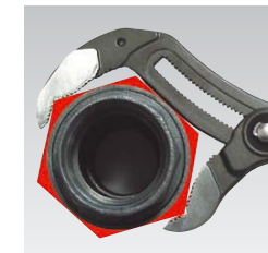
Cobra XL (longitud de 400 mm): Con una capacidad de la boca hasta 95 mm auna la potencialidad de una llave para tubos de la misma longitud