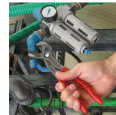
Utilización en conducciones neumáticas industriales