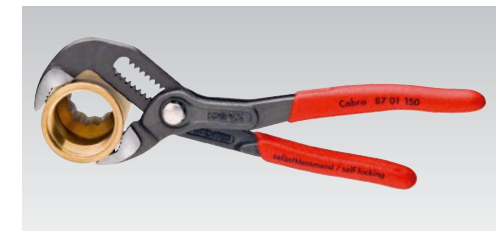
Mini-Cobra: herramienta en formato de bolsillo de gran utilidad