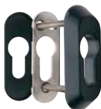
Detalle del escudo E210